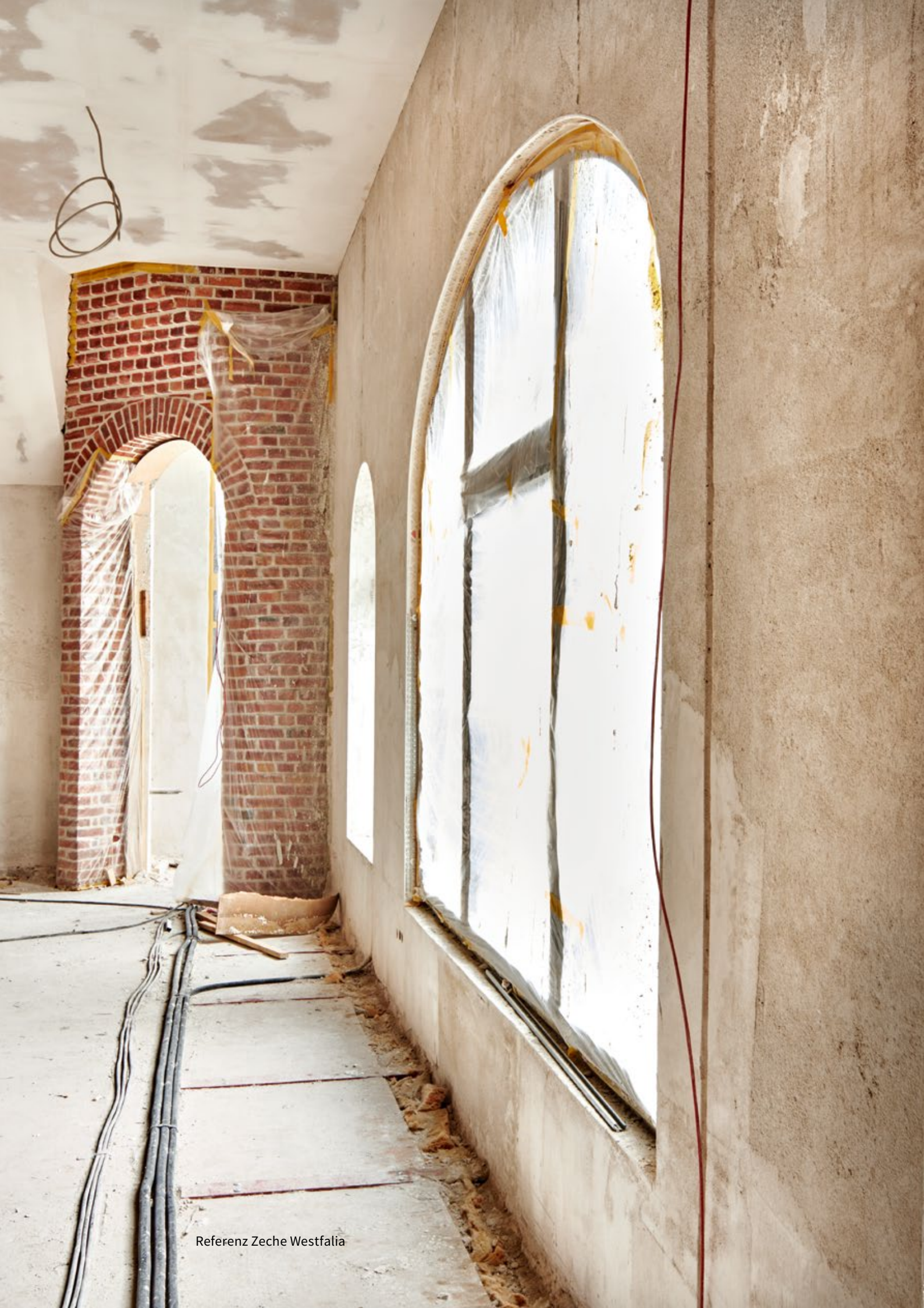
Referenz Zeche Westfalia