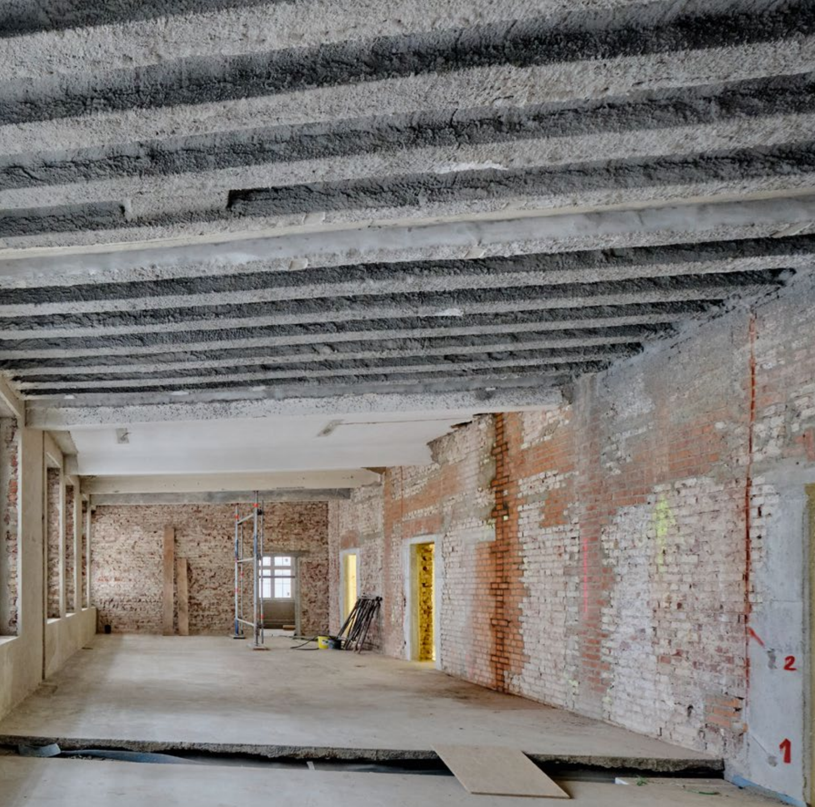
Fensterfront der Städt. Katholischen Hauptschule Leverkusen 60 mm TRI-O-THERM Auftrag auf unebenem Bestandsmauerwerk