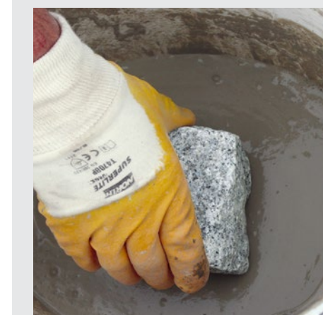
Plonger l'élément de revêtement dans la barbotine d'adhérence. Une autre alternative consiste à en enduire la face inférieure.