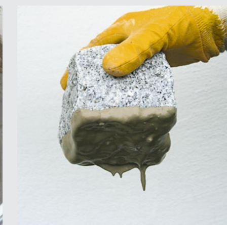
Recouvrir généreusement l'élément de revêtement de barbotine d'adhérence.