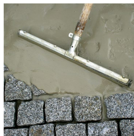
Appliquer le mortier de jointoiment hautement fluide et autocompactant.

Pour les pavages et les dallages à faible contrainte, la faible dilatation et l'élasticité optimale des matériaux de construction utilisés sont des éléments déterminants.