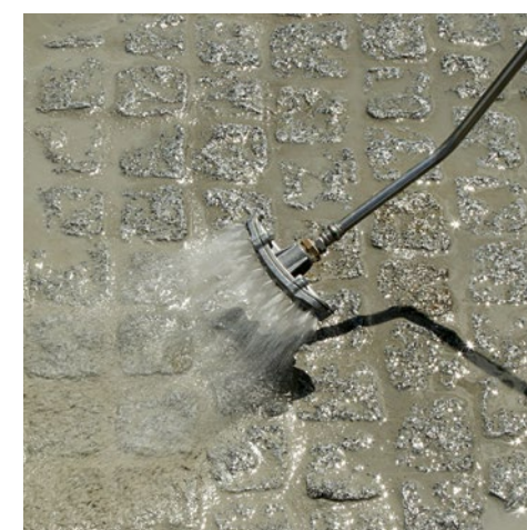
Rincer pour éliminer le mortier de jointoiment de la surface pavée.